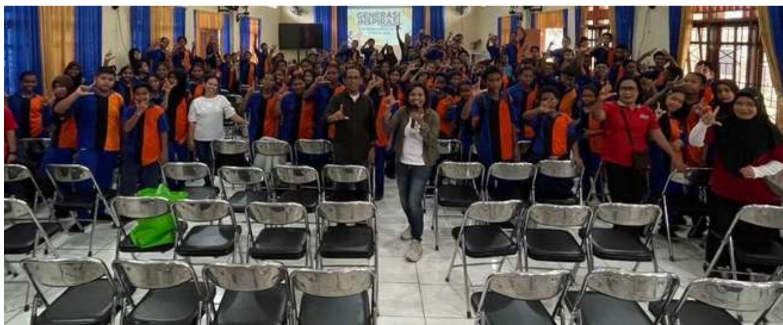
LIVING THE DREAM - SMPN & SMAN 2, SORONG