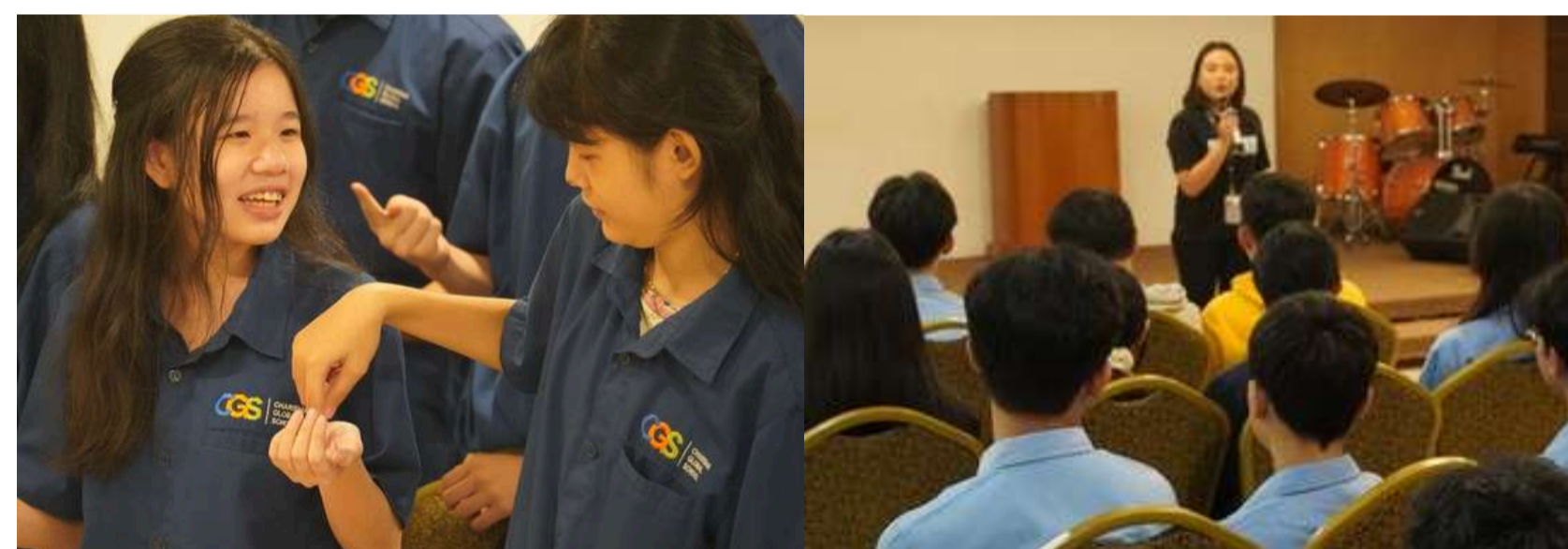
LIVING THE DREAM - CHARISMA GLOBAL SCHOOL, TANGERANG