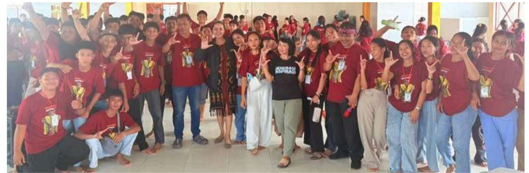
AKU HEBAT, AKU BISA, AKU & CINTA - SMK KRISTEN SERITI, SULAWESI SELATAN