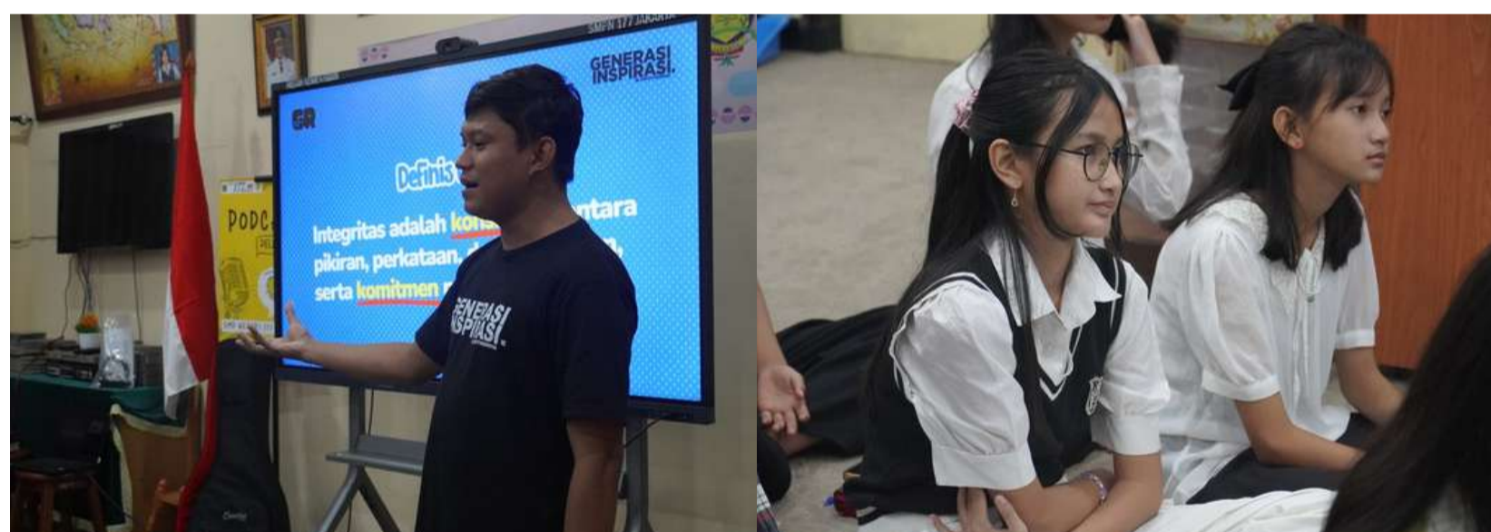
CHARACTER BUILDING - SMPN 177, BINTARO

Melalui sesi yang interaktif dan inspiratif, para siswa diajak untuk belajar mengenai nilai tanggung jawab, keberanian, kepedulian terhadap sesama, serta pentingnya memiliki mimpi dan tujuan hidup sejak dini. Generasi Inspirasi berharap setiap kegiatan yang dilakukan dapat terus memberikan dampak positif dan membantu membentuk generasi muda yang lebih percaya diri, berkarakter, dan siap menjadi berkat bagi lingkungan sekitarnya.