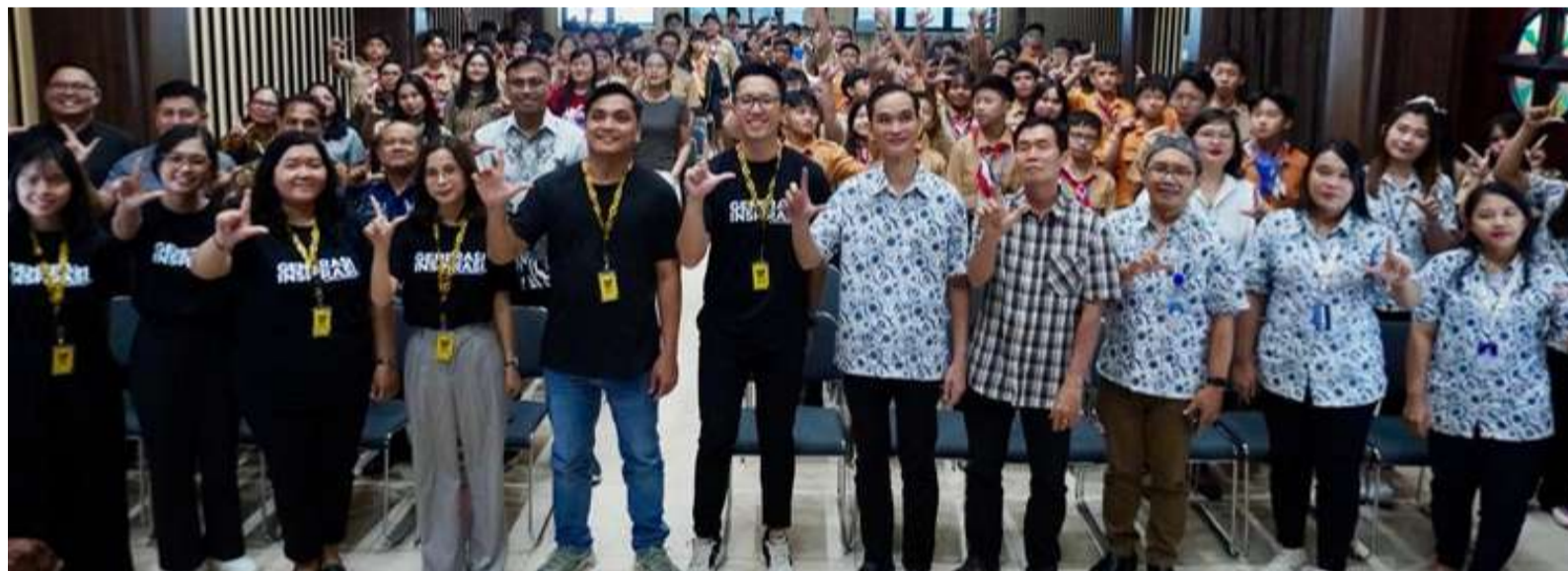
LIVING THE DREAM - SEKOLAH KALAM KUDUS, PADANG

Melalui sesi yang interaktif dan inspiratif, para peserta diajak untuk mengenali nilai diri, membangun karakter, menghadapi tantangan kehidupan, serta memiliki pola pikir yang positif dalam menjalani masa depan. Seminar ini diharapkan dapat membantu membentuk generasi muda yang lebih percaya diri, memiliki harapan untuk masa depan, dan mampu menjadi berkat bagi lingkungan di sekitarnya.