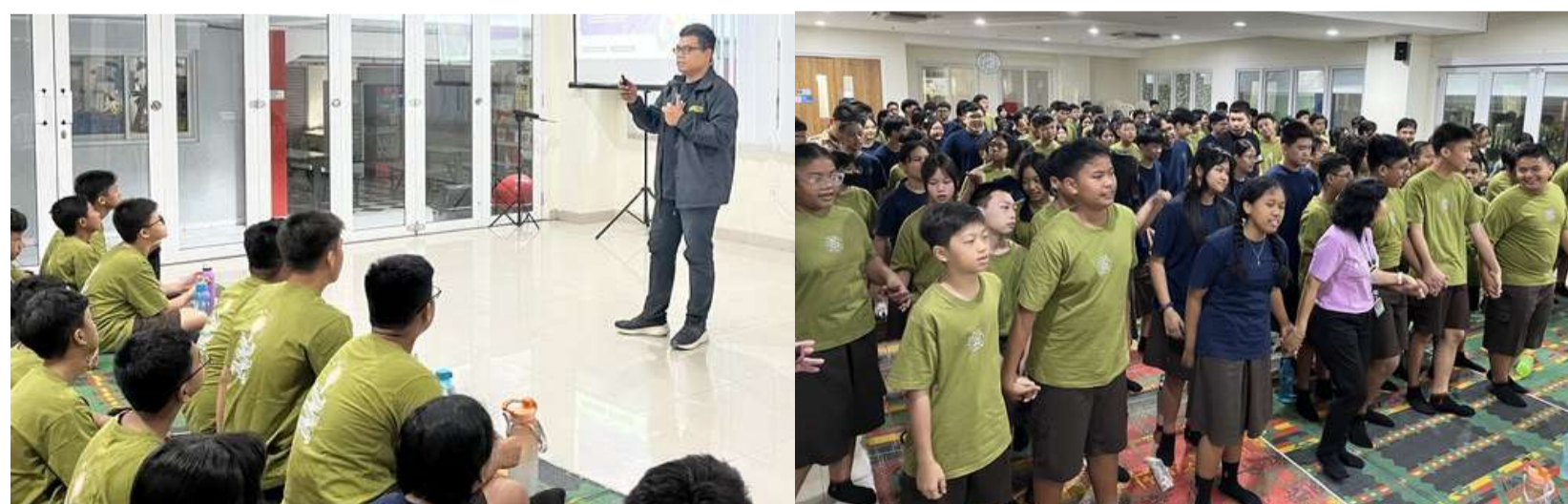
KEKERASAN & BULLYING - PENABUR, SERANG