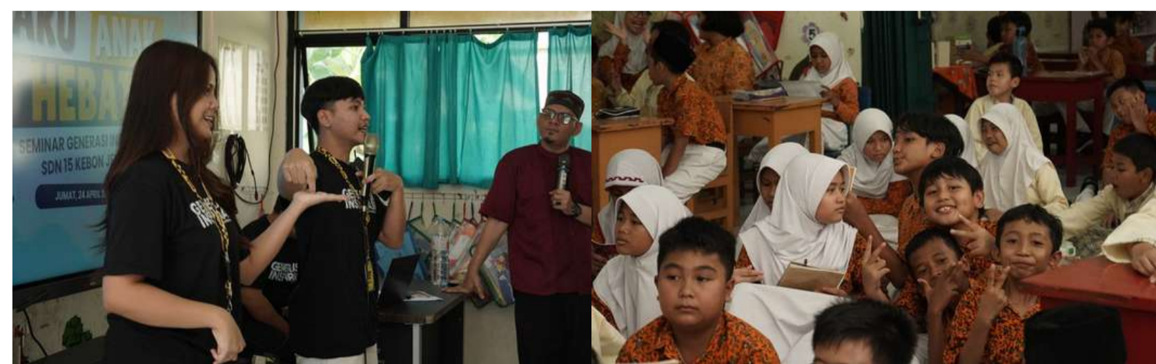
AKU ANAK HEBAT - SDN 15, KEBON JERUK